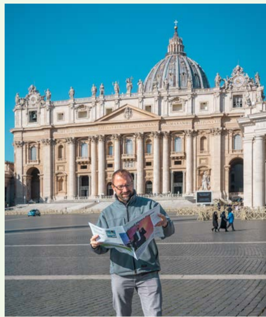
Unsere Good News Paper wird auch in Rom gelesen.